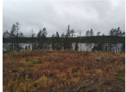
Keskimmäisen korttelin alue