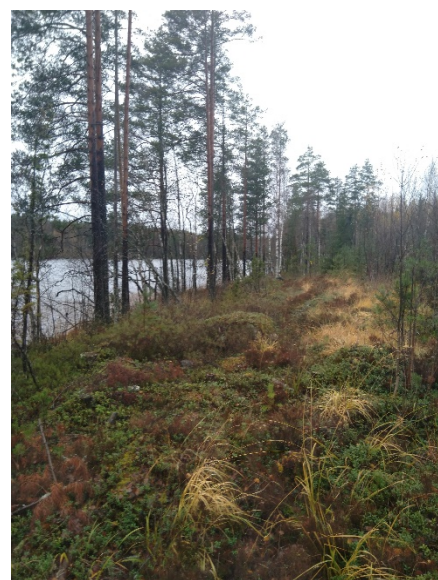
Rinnemaastoa pohjoisimman korttelin alueella maasto on hieman soistuvaa pohjoisimman rakennuspaikan kohdalla