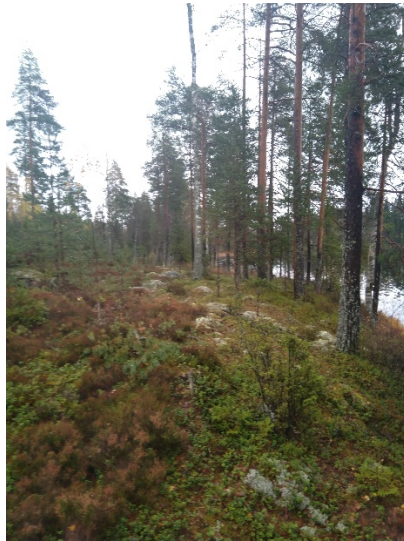
Eteläisimmän korttelin alue