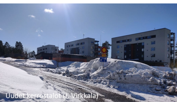
Uudet kerrostalot (J. Virkkala)