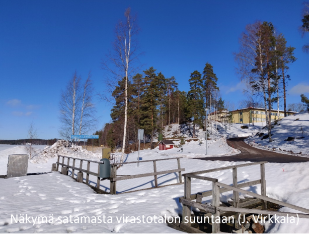
Näkymä satamasta virastotalon suuntaan