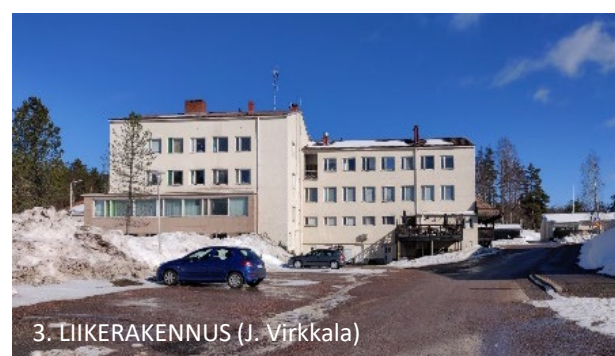
3. LIIKERAKENNUS (J. Virkkala)