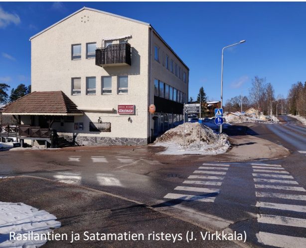
Rasilantien ja Satamatien risteys (J. Virkkala)