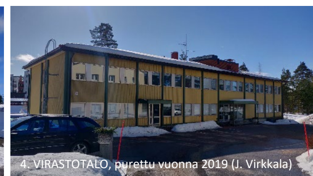
4. VIRASTOTALO, purettu vuonna 2019 (J. Virkkala)