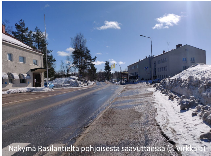
Näkymä Rasilantieltä pohjoisesta saavuttaessa (J. Virkkala)