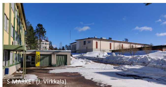
S-MARKET (J. Virkkala)